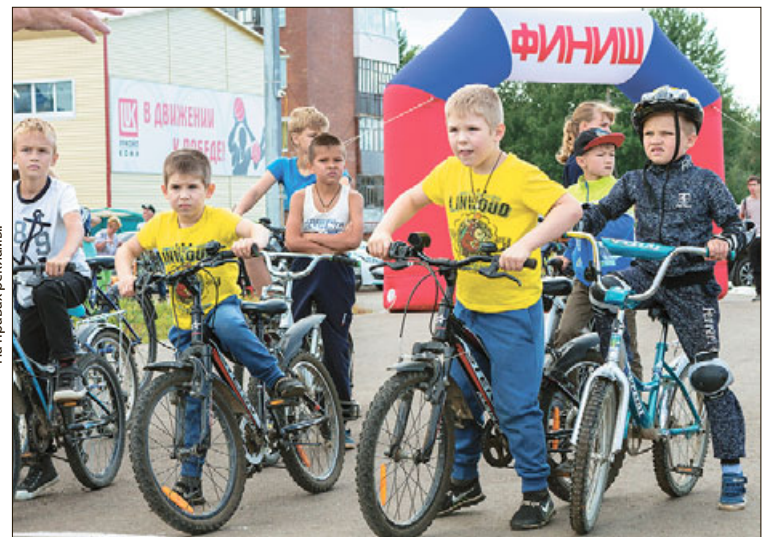
На правах рекламы.

«Я уже третий раз принимаю участие в шоу. Мне кажется, проведение такого рода соревнований весьма эффективно популяризирует спорт не только среди работников «ЛУКОЙЛа», но и среди населения, особенно молодёжи. Трудно современное подрастающее поколение от компьютеров оторвать. У меня самого двое детей – мальчик и девочка. Регулярно хожу заниматься в спорткомплекс и им стараюсь привить любовь к здоровому образу жизни», – по-