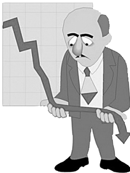
Рис. из сети интернет

Одно ближайшее изменение 2017 года – перенос убытков на будущее. Сначала хотели ограничить перенос 30 процентами, теперь в тексте закона, который направлен в Совет Федерации, стоит лимит в 50 процентов. Какие убытки подпадут под ограничение – все или только те, которые возникнут в 2017 году?