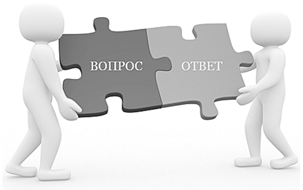
Рисунок из сети интернет

По какой причине предприниматель, ранее освобождённый от уплаты налога, получил налоговое уведомление в отношении принадлежащего ему магазина?