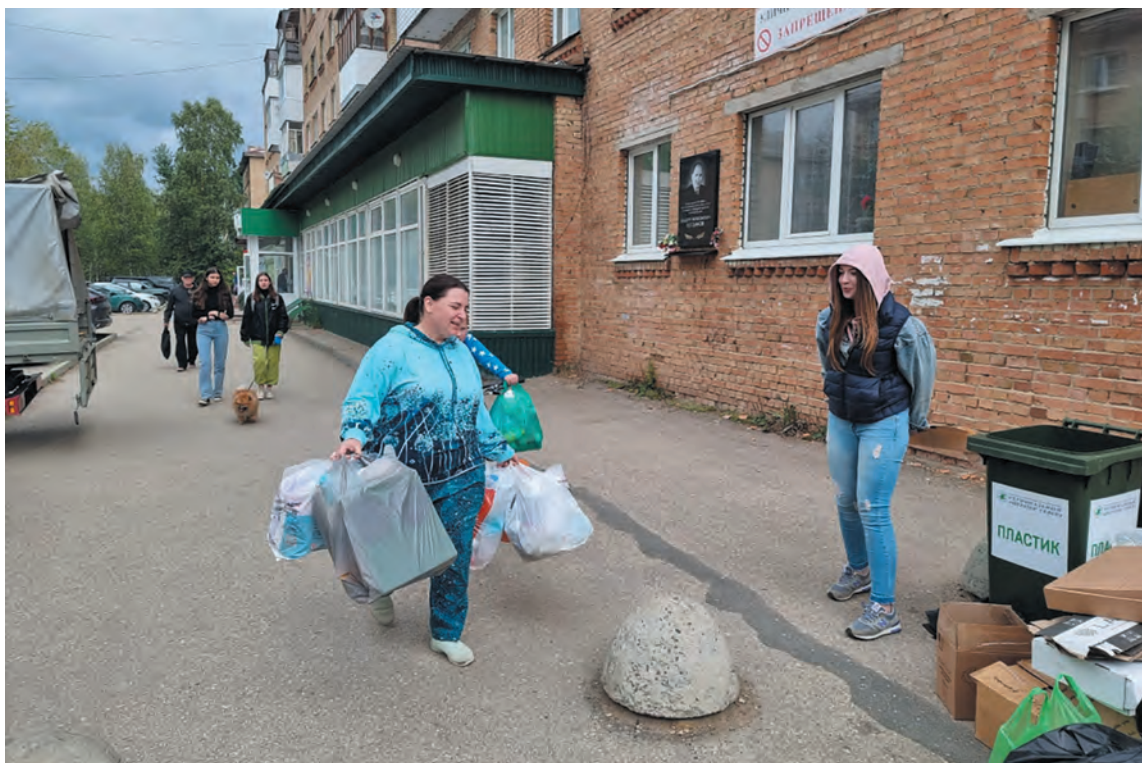
Акция «Зелёная суббота» в п. Водный

В сентябре на матчах мини-футбольных клубов «Ухта» и «Сибиряк» в рамках российской Суперлиги Региональный оператор Севера установил контейнеры для сбора пластика, бумаги и батареек. Все участники «Зелёной субботы», проходившей в спорткомплексе «Ухта», получали 15% скидку в фаншопе МФК «Ухта».